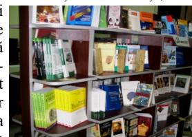
Raftul de referințe aflat în partea centrală a holului de la parter este poziționat în calea de acces

Principalul obiectiv în acest caz este acela de a încerca să îl faci pe utilizator să spună mai mult despre subiectul căutat. De ex: „Enciclopedia de botanică o găsiți fie la colecția de referință, fie la Sala de lectură. Aș putea să vă ajut mai mult, dacă îmi veți spune de ce anume aveți nevoie.” Bibliotecarul trebuie să încheie în așa fel mesajul încât răspunsul utilizatorului să fie mai mult decât un DA sau NU. În caz contrar utilizatorul nu va avea oportunitatea de a dezvolta subiectul căutat, în așa fel încât bibliotecarul să obțină indicii suplimentare despre nevoia sa de informație.