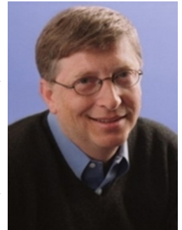
Bill Gates, președintele al Microsoft Corporation

Fundația „Bill și Melinda Gates” intenționează să includă România într-un program de informatizare a bibliotecilor publice din întreaga lume. Până în prezent, proiecte similare au fost inițiate în Chile, Mexic, Letonia și Lituania.