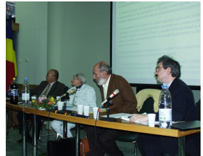
Prezidiul Conferinței. Imagine din timpul lucrărilor.