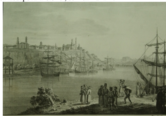
Orașul Galați (Moldova) [litografie], Viena 1826

Și tot pentru a omagia Dunărea, la sediul Bibliotecii „V.A. Urechia” din Galați, cititorii au putut admira expoziția „ Danubius Fluvius Europae Maximus ”, cu documente cartografice vechi: G. Reicchersdorff Chorographia, Koln, 1595 ; l'Origine del Daniubio, Venezia, 1685 ; Atlas Homannianus, Nurnberg, 1747 ; Atlas moderne, Paris, 177 ; Atlante Novissimo-Venezia, 1782 . N. Sanson Atlante, 1679 . Galațiul, marcat pe hărțile vechi expuse, cu o săgeată albastră, ducea tăcut povara istoriei, de Ziua Dunării.