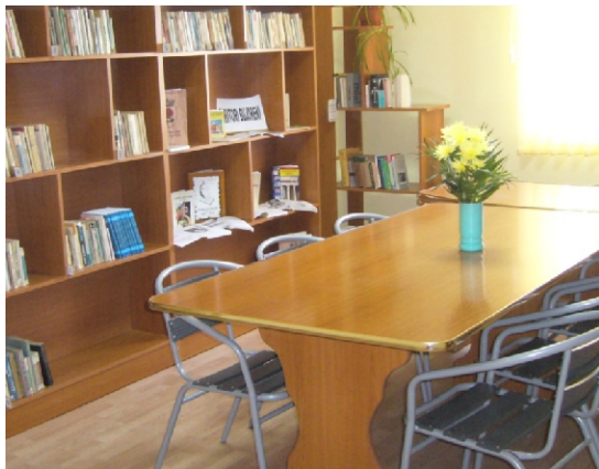
Sala de lectură a Filialei Sat Umbrărești