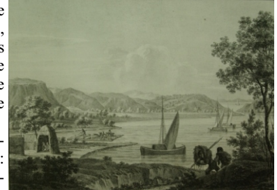
Gura de vărsare a râului Sereth (Siret) - Granița dintre Valahia și Moldova [litografie], Viena 1826

Orașul Brăila este reprezentat prin trei stampe: acivitatea portuară este intensă, multe corăbii ancorate în port. O litografie prezintă „Fortăreța Brăila”, înconjurată de puternice ziduri de apărare, supravegheate de un foșor în care sunt observatori înarmați. Un pâlcc de turci, călare, sunt gata de atac.