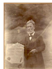
V. A. Urechia, the Moldavian-born Romanian historian (1834-1901). His book collection, which he had turned into a public library, is managed by the city of Galati, Romania