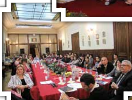
Aspecte din cadrul întrunirii profesionale și a ediției speciale a Salonului „Axis Libri”