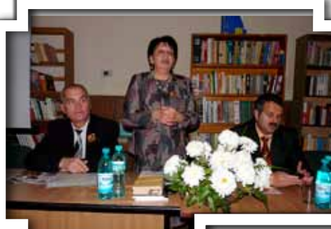
Aspecte de la manifestările prilejuite de aniversare