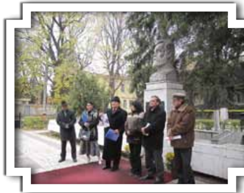
Moment omagial la statuia ctitorului V.A. Urechia

În cadrul celor trei ateliere pe secțiuni „Ponturi pentru realizarea portofoliilor școlare”, „Topul preferințelor în utilizarea bibliotecilor” și „Colaborări și parteneriate între bibliotecari și cadre didactice în interesul utilizatorilor” au fost inițiate discuții pe tema relației dintre bibliotecă și cadrele școlare, în privința îmbunătățirii serviciilor destinate elevilor și studenților ce constituie o categorie importantă a utilizatorilor bibliotecii și în privința