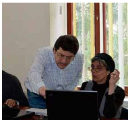
„Cum căutăm informația pe Internet”