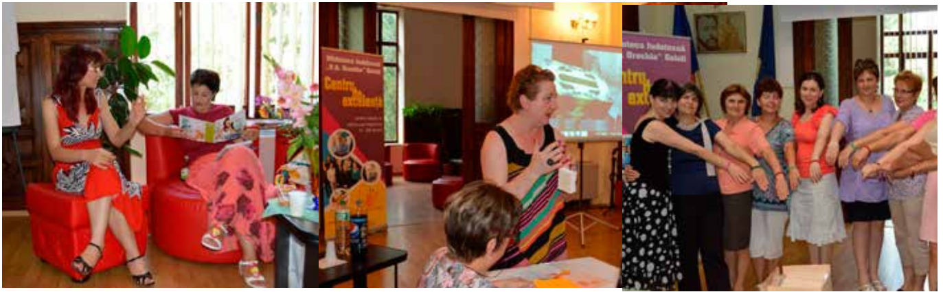
„Lecția de frumusețe”