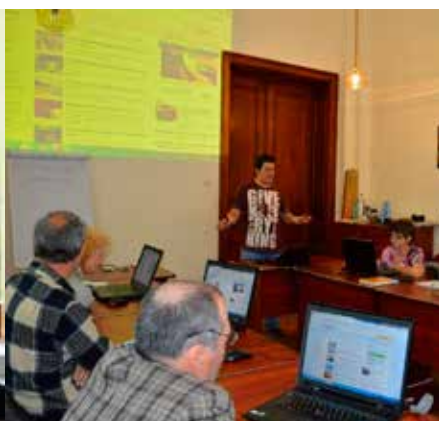
„E-mailul pentru toți”